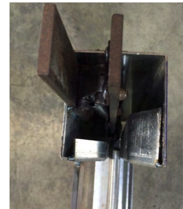
圖 1. 連桿與門片氣密設計

在防火和遮煙的功能需求上，公司研發一款具氣密性的防火捲門，來達成複合性功能的需求，預期在 CNS 14803 的防火測試，取得一小時以上防火時效，並在 CNS 15038 的遮煙測試，在最大 50 Pa 壓力下，洩漏量平均值不超過 25 m 3 /h，經過雙重檢驗規範的認證下，不管是在市場的特殊性和法規的適應性，會優於市場其他單一性能產品，對於未來的客戶需求也不怕任何考驗。